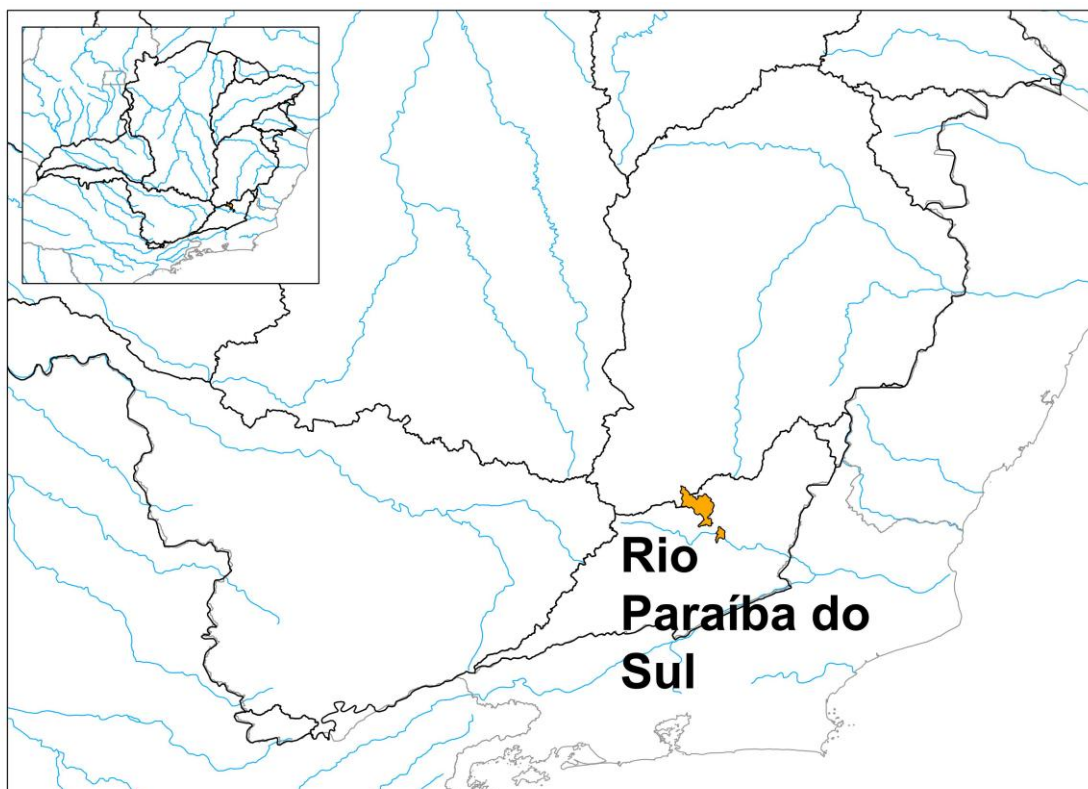
Figura 2: Localização dos municípios que solicitaram decreto de situação de emergência

De acordo com o boletim da Defesa Civil os municípios que solicitaram decreto de situação de emergência foram 167, sendo que na Bacia do Rio Paraíba do Sul foram 2, conforme figura e tabela abaixo.