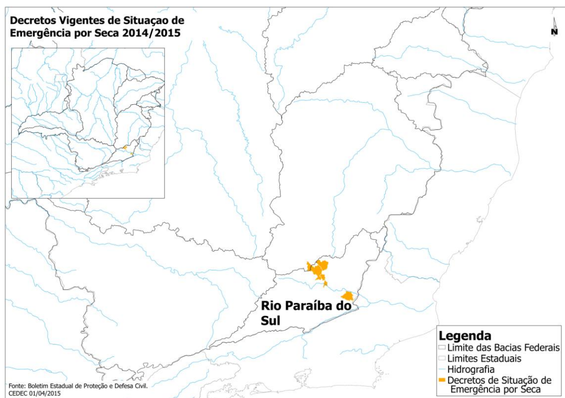
Figura 2: Localização dos municípios que solicitaram decreto de situação de emergência

De acordo com o boletim da Defesa Civil de 01/04/2015, os municípios com decreto de situação de emergência por seca vigente são 126, sendo que na Bacia do Rio Paraíba do Sul ocorreu apenas 05 decretos, conforme figura e tabela abaixo.