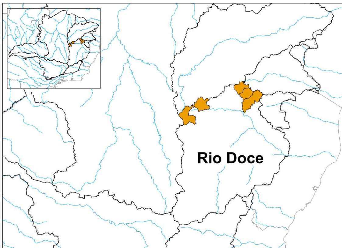
Figura 2: Localização dos municípios que solicitaram decreto de situação de emergência

De acordo com o boletim da Defesa Civil os municípios que solicitaram decreto de situação de emergência foram 171, sendo que na Bacia do Rio Doce foram 5 , conforme figura e tabela abaixo.