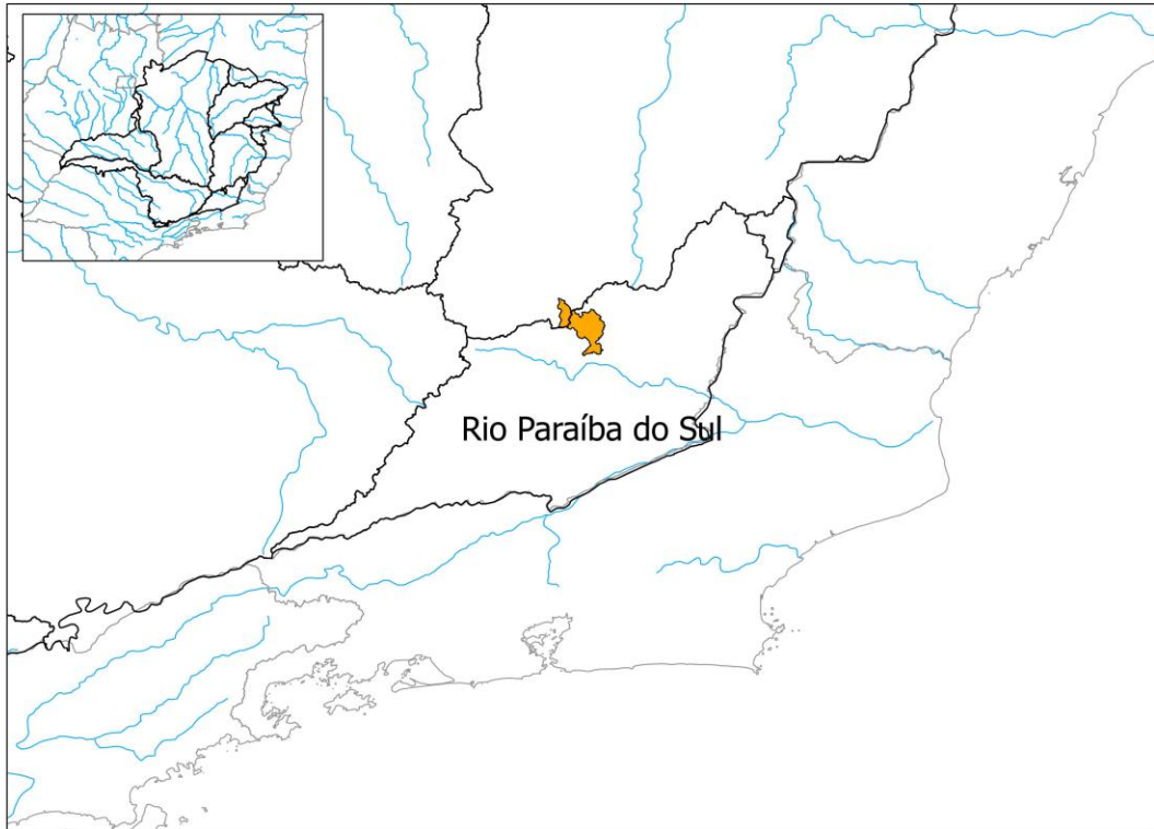
Figura 2: Localização dos municípios que solicitaram decreto de situação de emergência