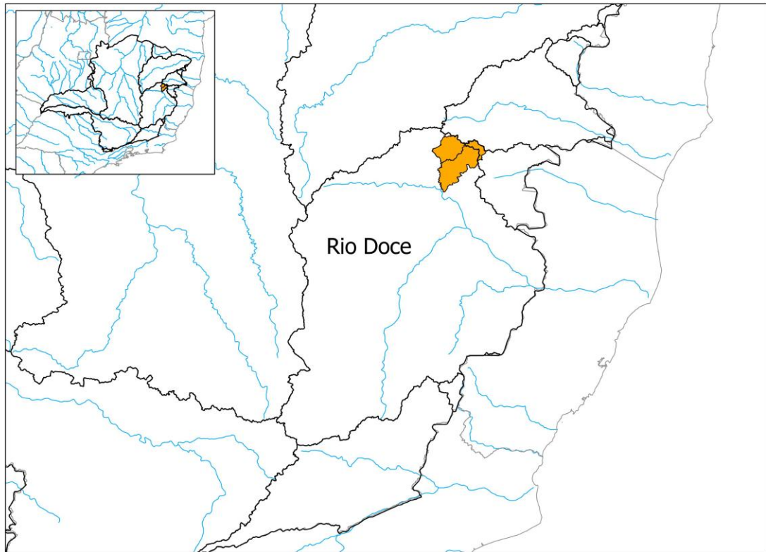
Figura 2: Localização dos municípios que solicitaram decreto de situação de emergência

De acordo com o boletim da Defesa Civil os municípios que solicitaram decreto de situação de emergência foram 155, sendo que na Bacia do Rio Doce foram 2 , conforme figura e tabela abaixo.