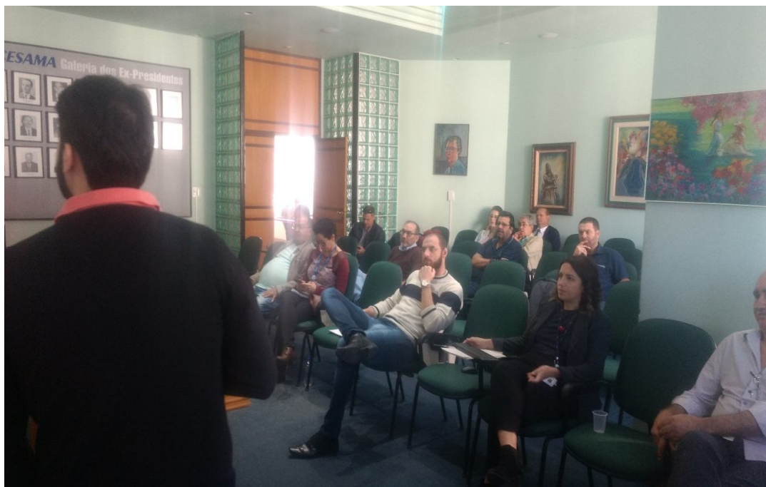
Figura 5. 2ª Reunião Extraordinária do Preto e Paraibuna, em 25.07.2019, em Juiz de Fora/MG