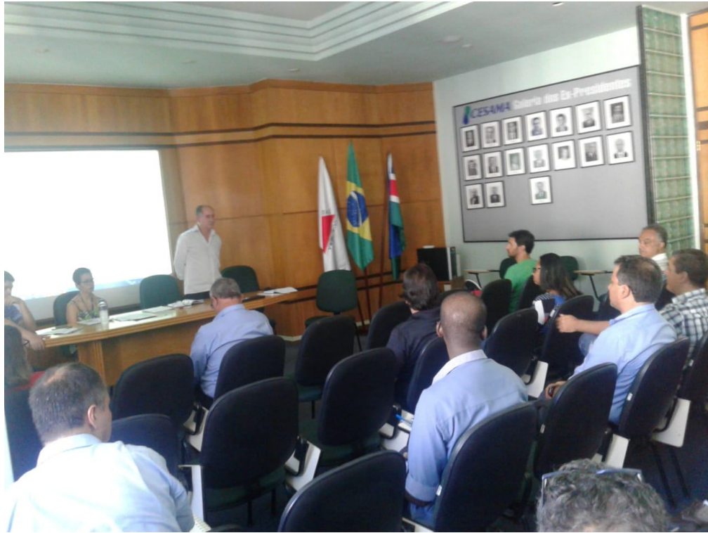
Figura 1. 1ª Reunião Ordinária do Preto e Paraibuna, em 20.02.2019, em Juiz de Fora/MG