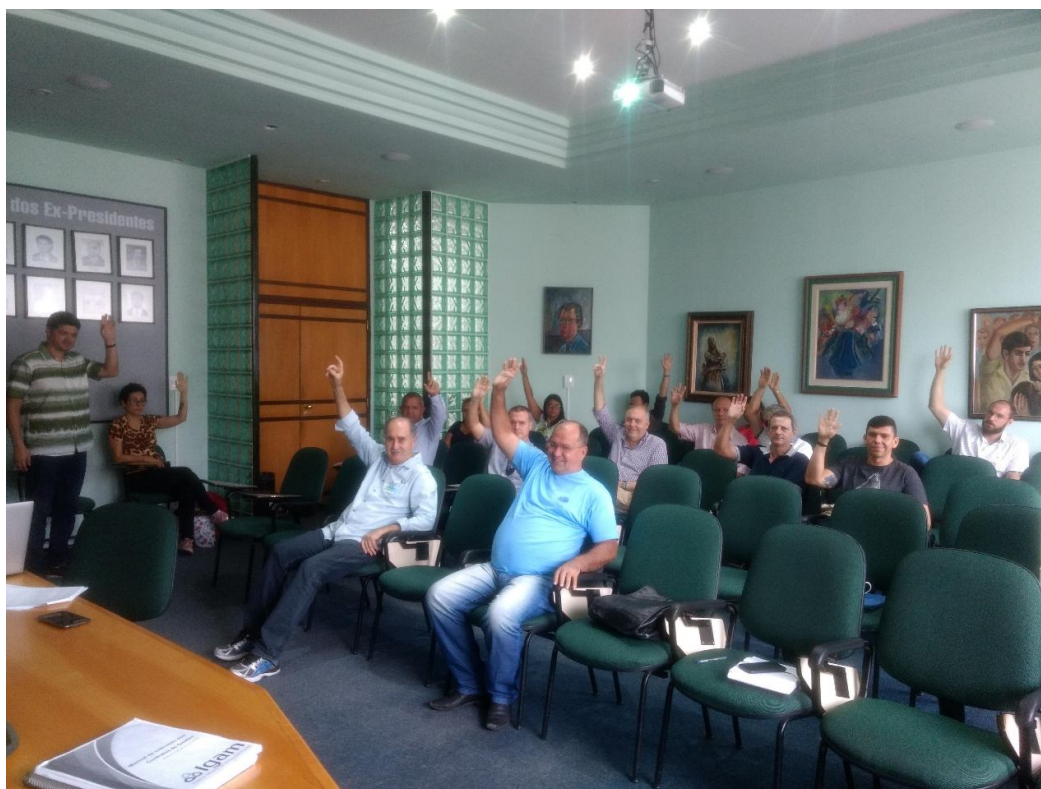
Figura 8. 3ª Reunião Extraordinária do Preto e Paraibuna, em 31.10.2019, em Juiz de Fora/MG