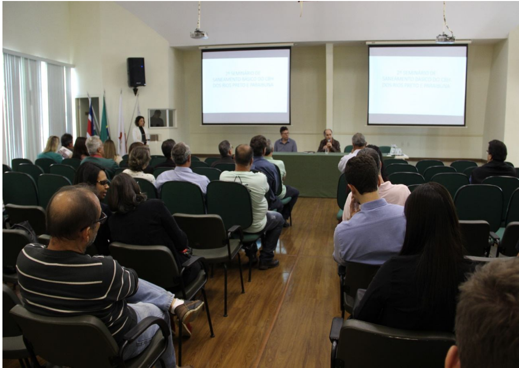
Figura 3. 1ª Reunião Extraordinária do Preto e Paraibuna, em 11.06.2019, em Juiz de Fora/MG