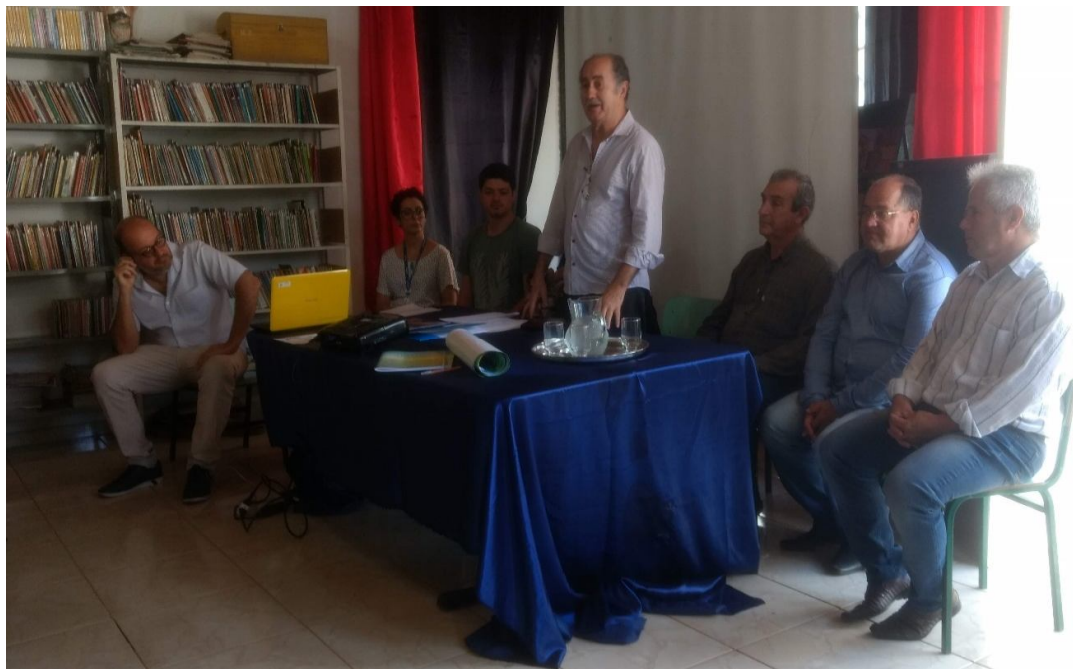
Figura 4. 3ª Reunião Ordinária do Preto e Paraibuna, em 27.06.2019, em Pedro Teixeira/MG