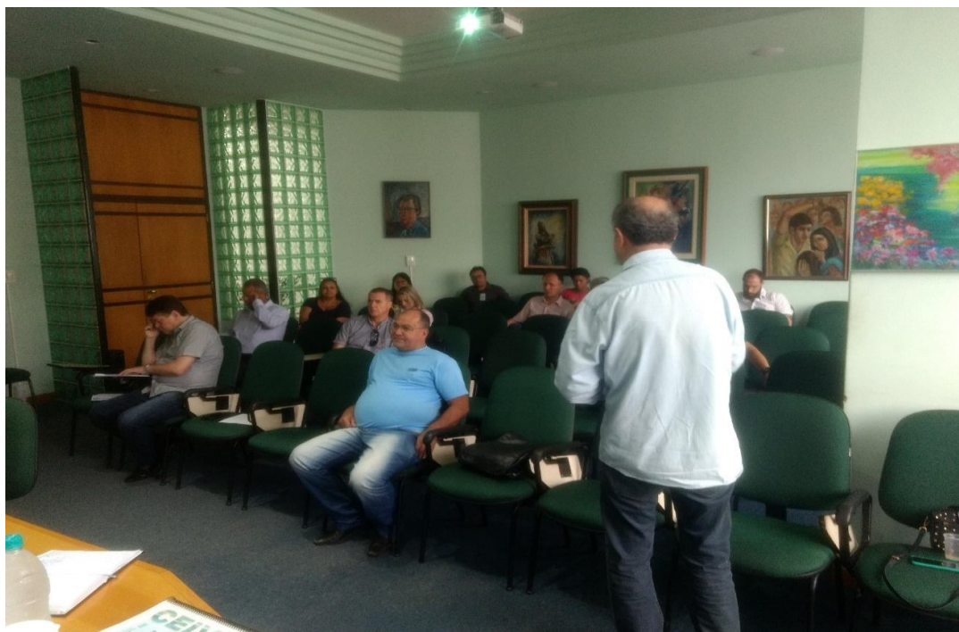
Figura 7. 5ª Reunião Ordinária do Preto e Paraibuna, em 31.10.2019, em Juiz de Fora/MG