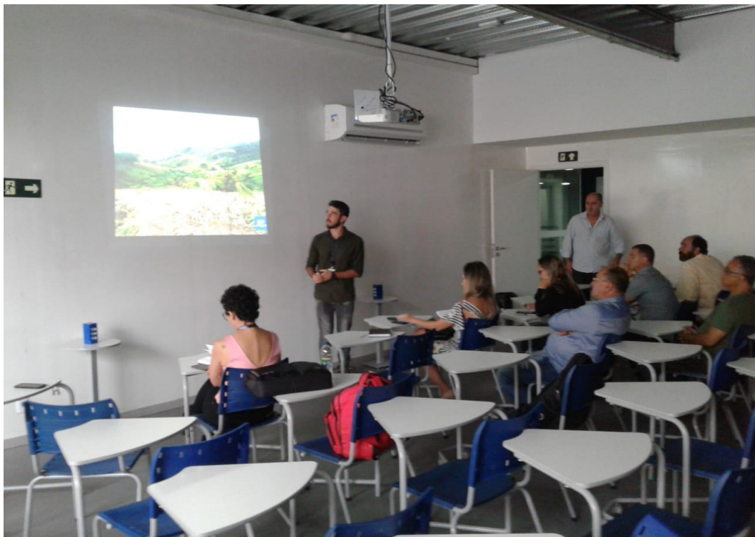
Figura 2. 2ª Reunião Ordinária do Preto e Paraibuna, em 25.04.2019, em Juiz de Fora/MG