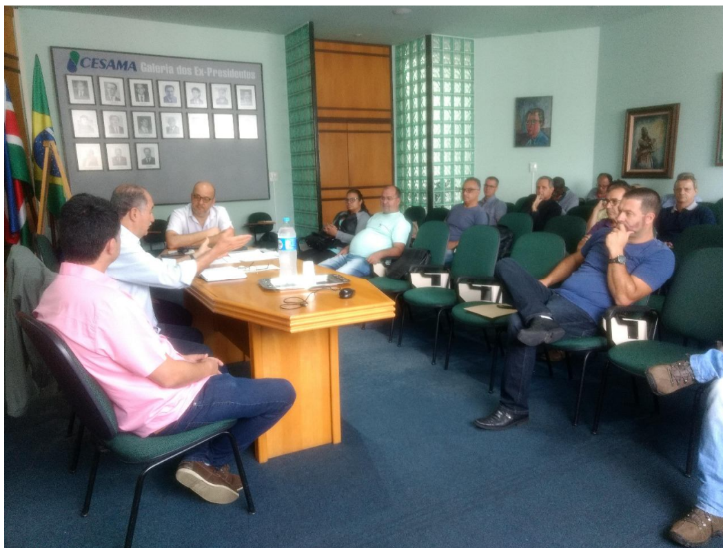
Figura 9. 4ª Reunião Extraordinária do Preto e Paraibuna, em 12.12.2019, em Juiz de Fora/MG