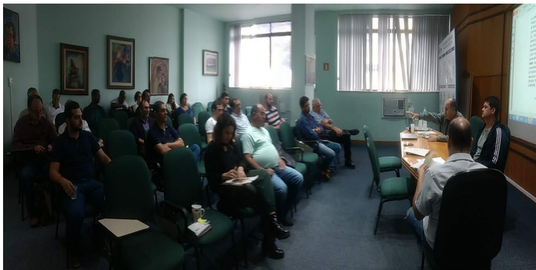
Figura 6. 4ª Reunião Ordinária do Preto e Paraibuna, em 05.09.2019, em Juiz de Fora/MG