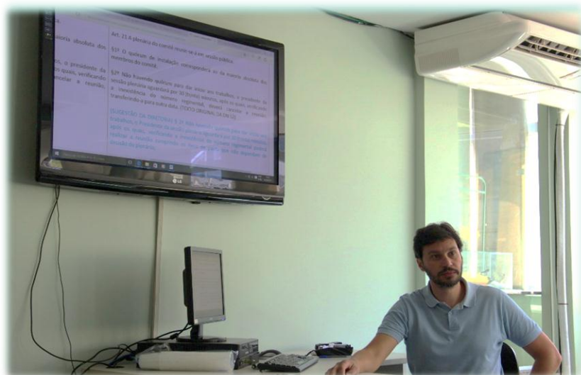
Figura 2. Presidente do PS1 durante a 1ª Reunião Ordinária do Preto Paraibuna

Porém, infelizmente, não houve quórum qualificado e, sendo assim, a pauta foi transferida para a 2ª Reunião Ordinária do Preto Paraibuna, ocorrida em 19.10.2017, em Juiz de Fora, na qual, finalmente, foi possível a aprovação do Novo Regimento Interno.