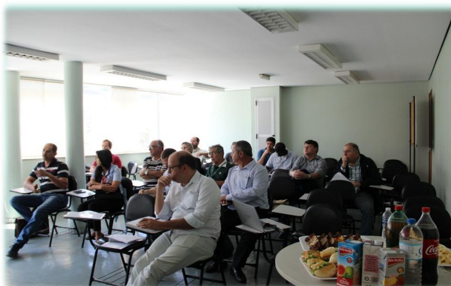
Figura 1. 1ª Reunião Ordinária do Preto Paraibuna, em 14.09.2017, em Juiz de Fora/MG

Sendo assim, em 14.09.2017, foi realizada a 1ª Reunião Ordinária do Preto Paraibuna, tendo como principais itens de pauta a apreciação e votação da minuta de Regimento Interno e a apreciação e votação da Ata da 6ª Reunião Ordinária de 2016.