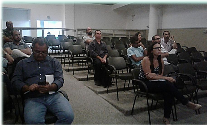
Figura 3. 2ª Reunião Ordinária do Preto Paraibuna, em 19.10.2017, em Juiz de Fora/MG

Porém, infelizmente, não houve quórum qualificado e, sendo assim, a pauta foi transferida para a 2ª Reunião Ordinária do Preto Paraibuna, ocorrida em 19.10.2017, em Juiz de Fora, na qual, finalmente, foi possível a aprovação do Novo Regimento Interno.