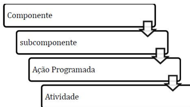
Figura 1. Estrutura de PAP proposta pelo Manual de Execução dos Contratos de Gestão – IGAM, 2019.

Observação: tendo em vista à estrutura apresentada no Caderno de Ações 5 - Área de Atuação do COMPÉ, que elenca 36 programas a serem desenvolvidos em sua região hidrográfica, estabeleceremos, para que o mesmo fique em consonância com o referido plano, os seguintes níveis de organização do PAP.